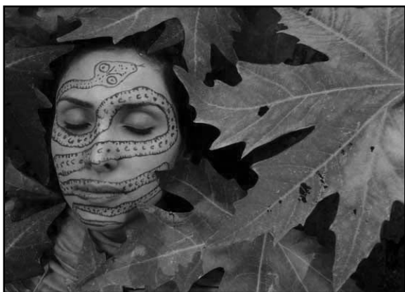
تصویر ۵- حوا در بهشت- نقاشی روی صورت با خاک‌های رنگی، (منبع: www.riverart.net ).