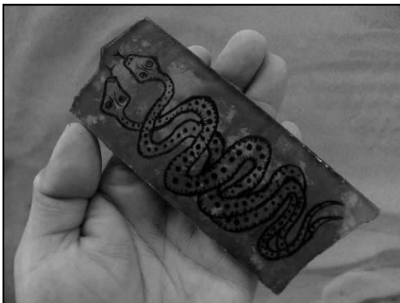
تصویر ۷- مارهای به هم پیچیده- نقاشی پشت شیشه با خاک‌های رنگی، (منبع: www.riverart.net ).