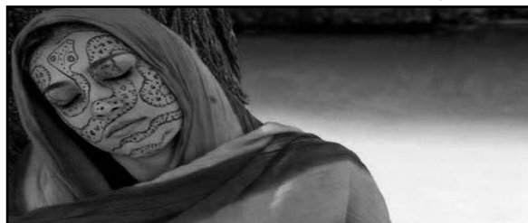
تصویر ۴- حوا در بهشت- نقاشی روی صورت با خاک‌های رنگی، (منبع: www.riverart.net )