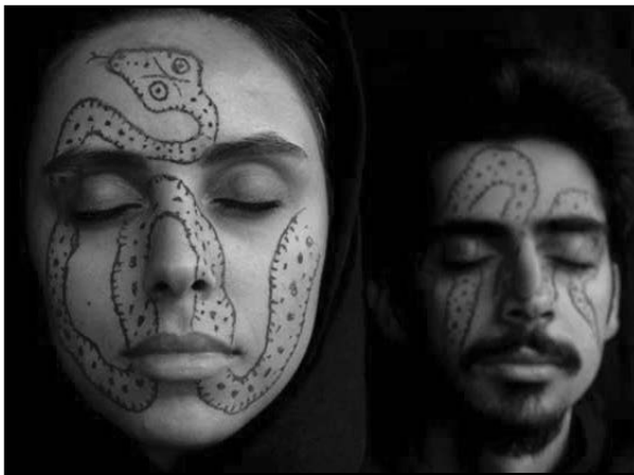
تصویر ۳- آدم و حوا- نقاشی روی صورت با خاک‌های رنگی، (منبع: www.riverart.net )