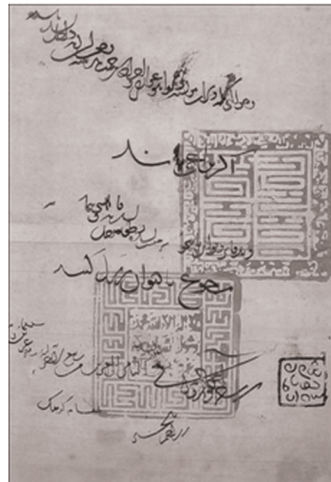
تصویر ۳- بخشی از یک سند مغولی درباره خراج دانستن یک روستا از املاک خاصه دولتی (اینجو) با دو تمغای چهارگوش. احتمالاً هر دوی این مهرها متعلق به امیر چوپان بوده است. تاریخ سند ۷۲۶ق. سازمان اسناد و کتابخانه ملی ایران (بخش اسناد)، مجموعه خصوصی (خاندان حکمت) شماره ۲۵۰/هدایی نک: شهرستانی، ۱۳۸۱: ۱۸-۱۷؛ شیخ‌الحکمایی، ۱۳۸۳: ۱۱۸-۱۱۱.

طبق روایت رشیدالدین فضل‌الله همدانی در تاریخ مبارک‌غازانی، امیرنوروز به غازان خان پیشنهاد کرده بود که شکل مربع تمغای ایلخان مغول مدور شود، چون دایره افضل‌الاشکال است (رشیدالدین فضل‌الله همدانی، ۱۳۸۸: ۹۶). اما گویی افضل‌الاشکال مهرهای اسلامی در آن دوران همچنان مربع