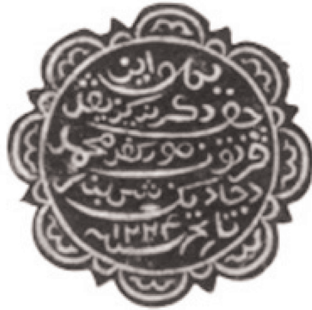
تصویر ۲- نمونه‌ای از مهرهای به اصطلاح لوتوسی شکل مالایی از قرن سیزدهم هجری قمری

است (افضل الملک، ۱۳۶۱: ۱۹ و ۳۶۲) و این نکته بازگویای نوعی سلیقه در نام گذاری اشکال مهرهای متأخر اسلامی است.