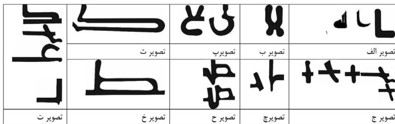
جدول ۲- حروف گروه دوم، پنجم. منبع: (نگارندگان).

«ک» وجه تمایز کتیبه‌های این گروه نسبت به سایر گروه‌هاست که در بعضی از قسمت‌ها استفاده شده‌است (جدول ۳، تصویر پ). در این گروه، علاوه بر کلمه «محمد»، حروف کلماتی دیگر مانند «الملک» بدون زائده اتصال کنار هم قرار گرفته‌اند. فرم کلمه «لا» دارای انحناست (جدول ۳، تصویر ت). تنوع نوشتار در فرم حرف «ج» همانند سایر گروه‌ها (جدول ۳، تصویر ث)، حروف کشیده مضاعف در حروف «ص»، «د» و همچنین در «م» وسط مشاهده می‌شود (جدول ۳، تصویر ج). کشیده کوتاه در حروف «ل» و «ط» استفاده شده‌است (جدول ۳، تصویر چ).