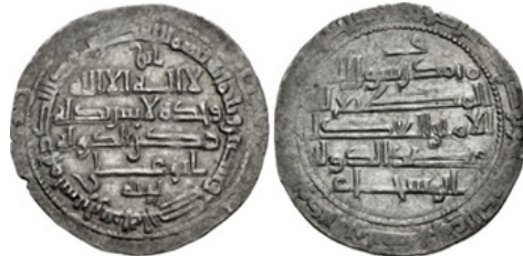
تصویر ۳- عضدالدوله، شیراز، ۳۶۱ هـ.ق. (URL:1)

جدول ۱- حروف گروه اول، پنجم. منبع: (نگارندگان).