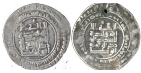
تصویر ۱۳- عضدالدوله، سیراف، ۳۴۶ هـ ق.