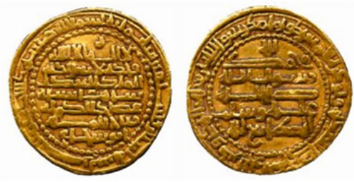
تصویر ۸- عضدالدوله، ۳۷۲ هـ.ق، بصره. منبع: (URL:1)

جدول ۳- حروف گروه سوم، پنجم. منبع: (نگارندگان).