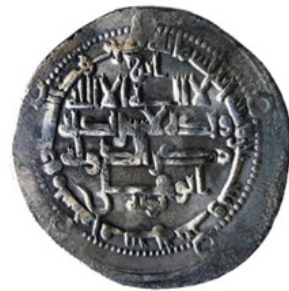
تصویر ۵- عضدالدوله ابوشجاع، ۳۶۳ هـ.ق، سیراف.

برحسب سلیقه خوش‌نویسان بلاد مختلف در قلم و شیوه نگارش، تنوعاتی در خط کوفی کهن عربی به نظر می‌رسد. این تنوعات را غالباً در چگونگی آغاز کتابت حروف «الف» و «ل» و تمایل آن‌ها به جانب راست یا چپ می‌توان دید (فکرت، ۱۳۷۷). در خط کوفی، حرف «الف» در ابتدا به شکل ساده نگارش شده و به مرور ایام و با تصرفات نویسندگان و تزینات و تغییرات بعدی، تغییر شکل داده است (مشیری، ۱۳۵۴: ۱۳). از ویژگی‌هایی که در ایجاد این گروه موثر بوده، حضور حرف «الف» با زائده به بیرون است که یادآور خط کوفی اولیه است (جدول ۲، تصویر الف). ویژگی دیگر، کلمه «لا» است که به صورت ضربدری طراحی شده (جدول ۲، تصویر ب). «ی» معکوس در این گروه استفاده نشده و فرم «سی» و انتهای «ع» در مقایسه با سایر حروف، منحنی‌تر و متفاوت با سایر حروف نگارش شده است (جدول ۲، تصویر پ). حروف کشیده مضاعف، جز در موارد معدود، مانند حرف «د» در این گروه مشاهده نمی‌شود (جدول ۲، تصویر ت). حروف «ع»، «ل»، «ح» و «د» دارای کشیدگی متعادلی در قیاس با ترکیب کلی کتیبه هستند (جدول ۲، تصویر ث). فرم «ح» بیشترین تنوع فرم را دارد (جدول ۲، تصویر ج). زائده زیر «الف» چسبیده و همچنین در «ح» و «ج» وسط در این گروه استفاده شده است (جدول ۲، تصویر چ و ج). فرم U و V شکل در بعضی اتصالات، مانند اتصال حرف «ص» به «د» دیده می‌شود (جدول