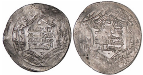
تصویر ۱۲- عضدالدوله، شیراز، ۳۴۵ هـ ق.