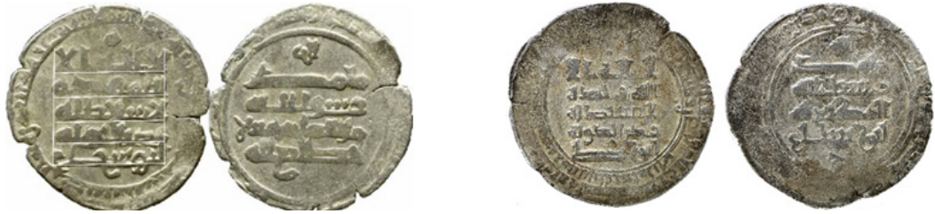
تصویر ۱۵- عضالدوله، بصره، ۳۶۹ هـ.ق.