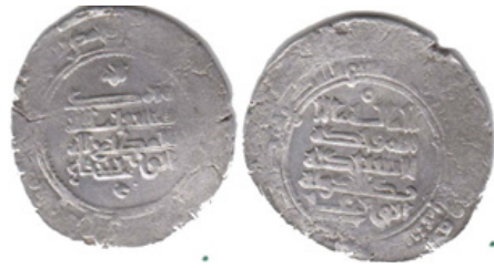
تصویر ۱- عضالدوله، ۳۴۰ هـ.ق.