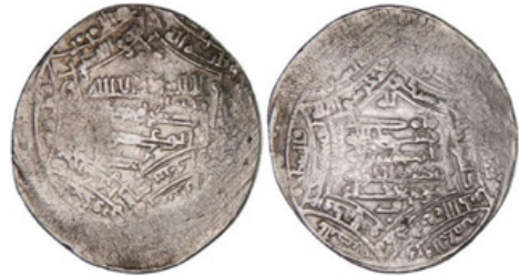
تصویر ۱۱- عضدالدوله، شیراز، ۳۴۶ هـ ق.