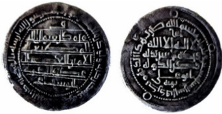
تصویر ۴- عضدالدوله- فناخسرو، ۳۶۰ هـ.ق. منبع: (علاءالدینی، ۱۳۹۷: ۲۷۹)