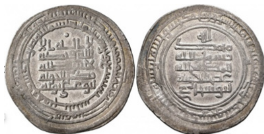
تصویر ۷- عضدالدوله، ۳۴۹ هـ.ق، گناوه.

سکه‌های این گروه از سال‌های ۳۴۵ تا ۳۵۶ هـ.ق ضرب شده‌اند. فرم حروف در این گروه، مشابه گروه اول است. آنچه سبب شده گروه مجزا تشکیل شود، ظاهر کلی خط است که در مقایسه با گروه قبل، ضخیم‌تر بوده و تمام حروف دارای ضخامت یکسانی ۱ هستند. همان‌طور که دروش در روش خود بیان می‌کند، علاوه بر شکل حروف،