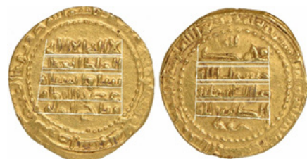
تصویر ۱۰- عضدالدوله، موصل، ۳۶۹ هـ.ق. منبع: (URL:2)

با توجه به اینکه نمونه سکه‌های به دست آمده در این گروه بسیار کم‌اند، بعضی از حروف مورد بررسی در گروه‌های دیگر، در این گروه موجود نیست. همچنین نمی‌توان میزان پراکندگی ضرب این گروه سکه‌ها را در دوره حکومت عضدالدوله به‌طور مشخص بیان کرد. ضمناً بعضی سکه‌ها بسیار آسیب‌دیده بودند یا تصاویر در دسترس، دارای کیفیت کافی نبودند و اجرای حروف سخت بود که سعی شد با بیشترین دقت انجام شود حروف در کتیبه‌های این گروه، با اینکه در همان قالب و فرم حروف گروه اول نگارش ۱۲ شده‌اند، فرم تزیینی دوشاخه در انتهای حروف (جدول ۵، تصویر الف) و همچنین سایر عناصر