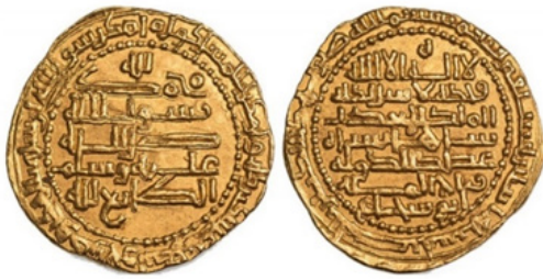
تصویر ۹- عضدالدوله، ۳۷۲ هـ.ق، بصره.