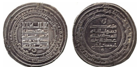
تصویر ۶- عضدالدوله، ۳۴۴ هـ.ق، بهبهان.