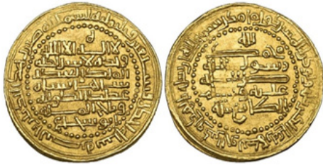
تصویر ۲- عضالدوله، بصره، ۳۷۱ هـ.ق.